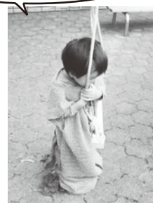
みのむしブランコ