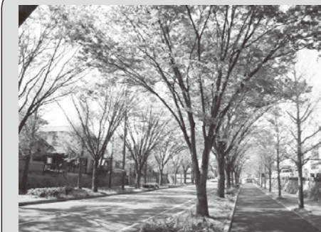
新林本通りのケヤキ並木

主 催：洛西ニュータウン創生推進委員会 環境部会 075-332-9318 (洛西支所まちづくり推進課内)